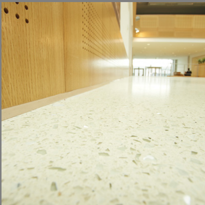
Terrazo continuo epoxi